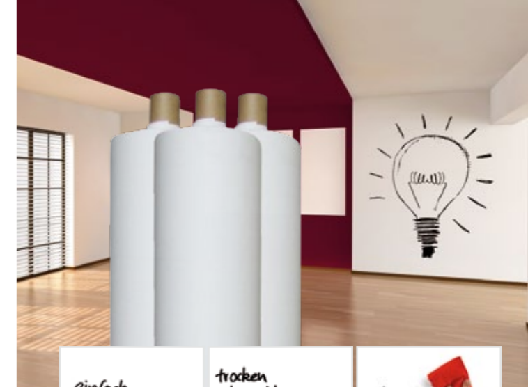
Startklar: alle Komponenten sind bereits vorkonfiguriert