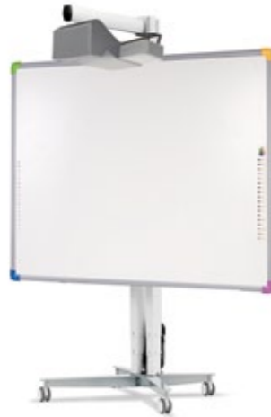
Das Interwrite™ DualBoard mit Rollständer von SMS™

Die Produktpalette von SMS™ ist sehr umfangreich und bietet Halterungen für Konferenztechnik oder Unterhaltungselektronik bis hin zu höhenverstellbaren Lösungen für mobile interaktive Boards in Schulen an.